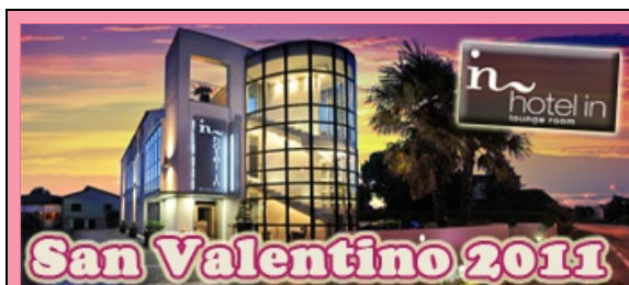
San Valentino Hotel In